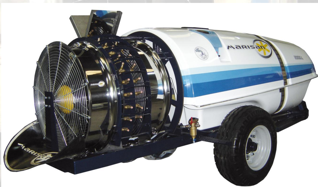
BALBASTRE Y SANJAIME SL MARISAN